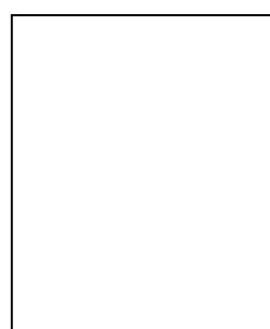
Cap Ibu Jari kanan